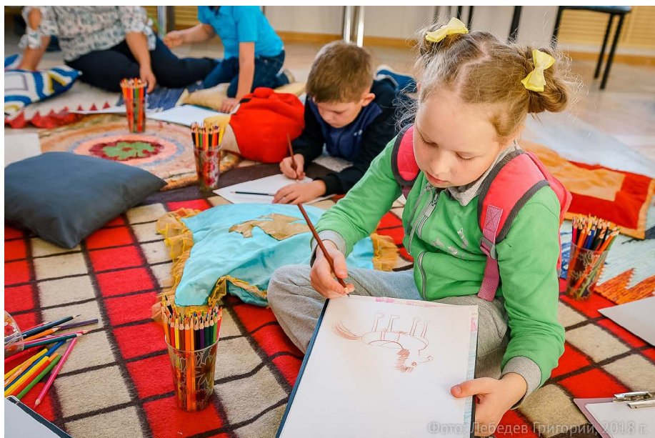
Фото: Лебедев Григорий, 2018 г.